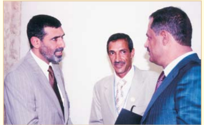
معالي رئيس الوزراء اليمني الدكتور على محمد مجور يستقبل سعادة رئيس الهيئة