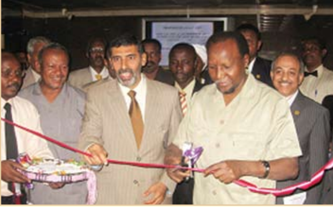
معالي الدكتور عيسى بشري محمد - وزير الدولة بوزارة العلوم والتقانة بجمهورية السودان وسعادة رئيس الهيئة لدى افتتاح المكتبة

تم التعاقد مع الشركة الموردة لنظام NewGenLib وتم تركيب النظام بمكتبة الهيئة وتدريب كادر المكتبة عليه وكذلك تدريب كادر من تقنية المعلومات على ما لزم من النظام بغرض الدعم الفني. نسبة للإقبال المتزايد على مكتبة الهيئة من قبل الباحثين برزت ضرورة