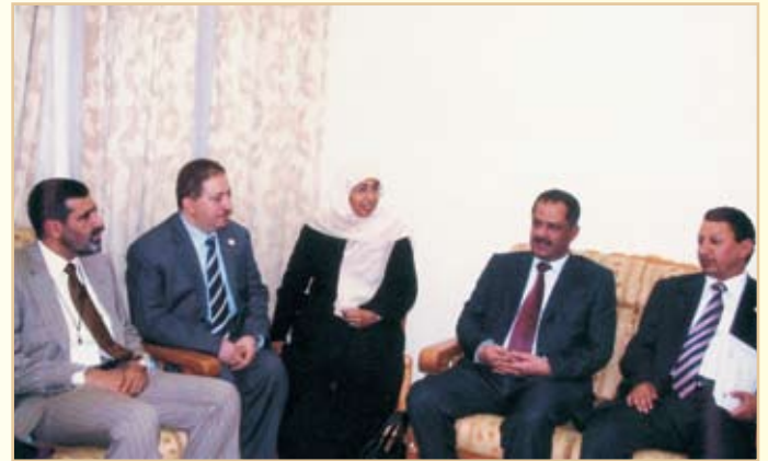
معالي رئيس الوزراء ومعالي وزير الزراعة اليمني وسعادة رئيس الهيئة وعدد من المسؤولين اليمنيين