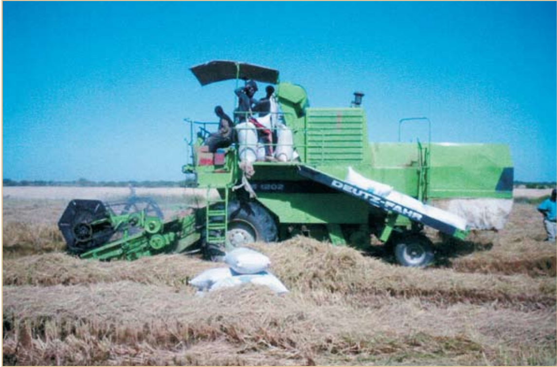
حصاد محصول الأرز بمشروع أمبورية الزراعي الجمهورية الإسلامية الموريتانية