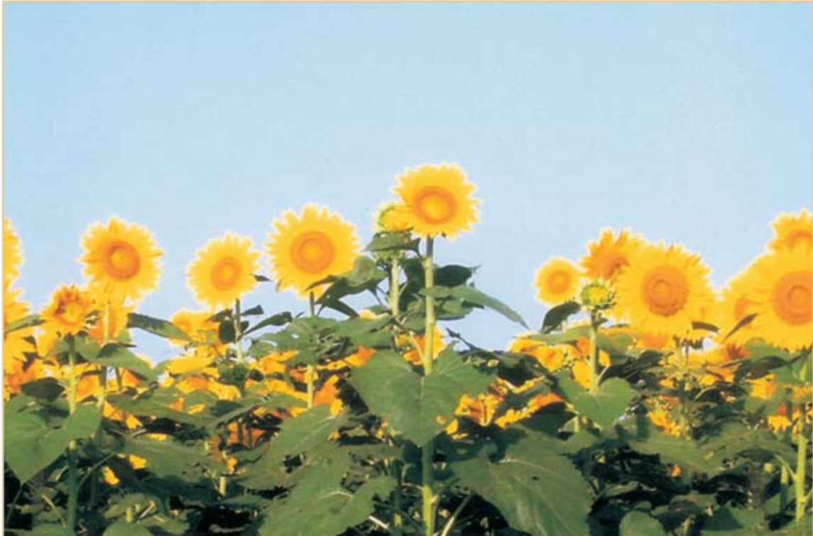
تجارب زراعة أصناف من محصول زهرة الشمس بنظام الزراعة بدون حرث / أقدي / السودان / 2007