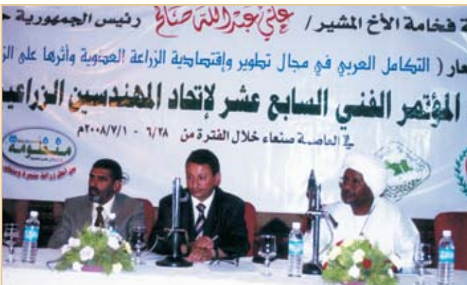
معالي وزير الزراعة اليمني يتوسط سعادة رئيس الهيئة ورئيس اتحاد المهندسين الزراعيين السوداني